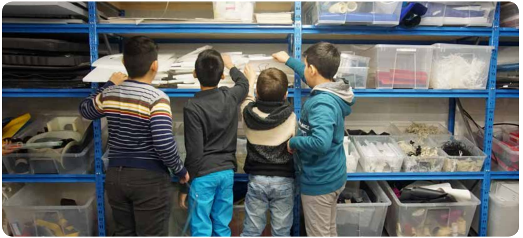
Grundschul Kinder auf Erkundungstour im einfallreich

Für die Elementar- und Grundschuldidaktik ist vor allem bedeutsam (vgl. Duderstadt 2004), wie Kinder durch das Sammeln