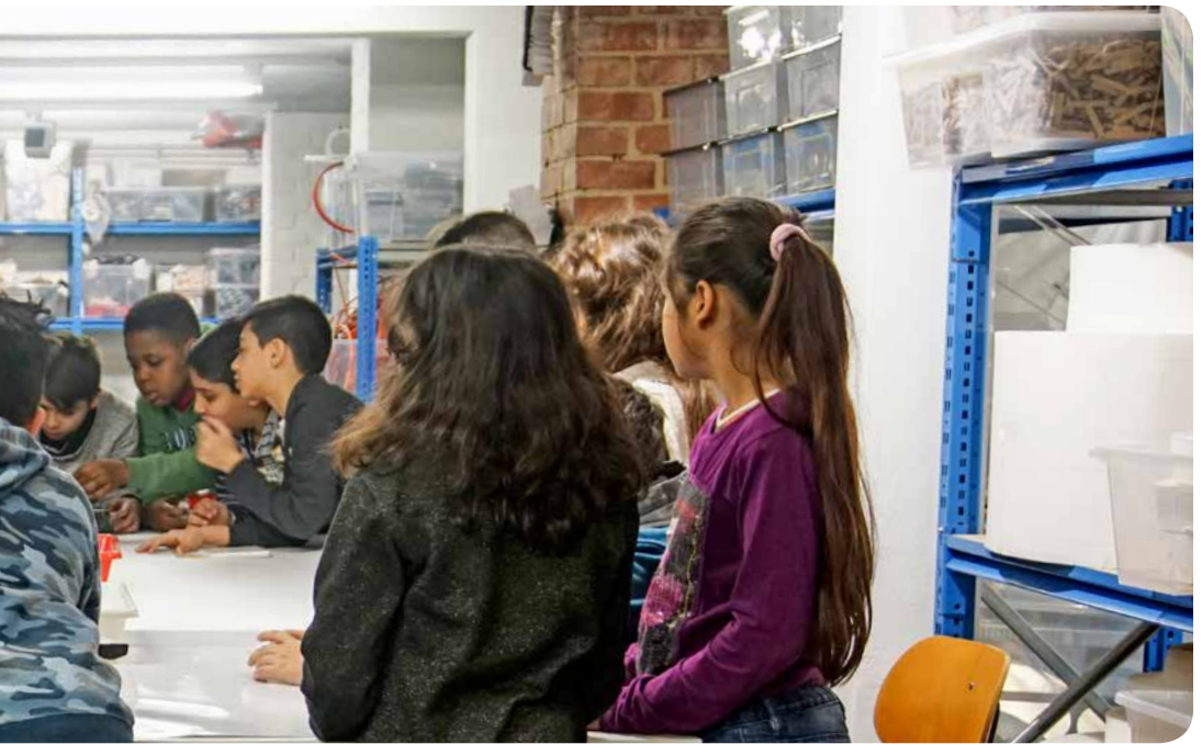
Ganz schön viel los: Blick in Materialsammlung und Werkstatt

Vernetzung Lernende Netzwerke zwischen pädagogischen Institutionen bilden ein zukunftsorientiertes Bildungssystem. Forschung, Ausbildung und Praxis können sich wechselseitig anregen und interagieren, um eine nachhaltige Förderung kindlicher Bildung zu gewährleisten. In diesem Sinne arbeiten bei der NetzWerkstatt einfallsreich! das nifbe, Hochschule, Universität, Kunstschule, Kitas und Schulen zusammen, um die Praxis des selbsttätigen und spielerischen Lernens nachhaltig in den pädagogischen Systemen zu verankern.